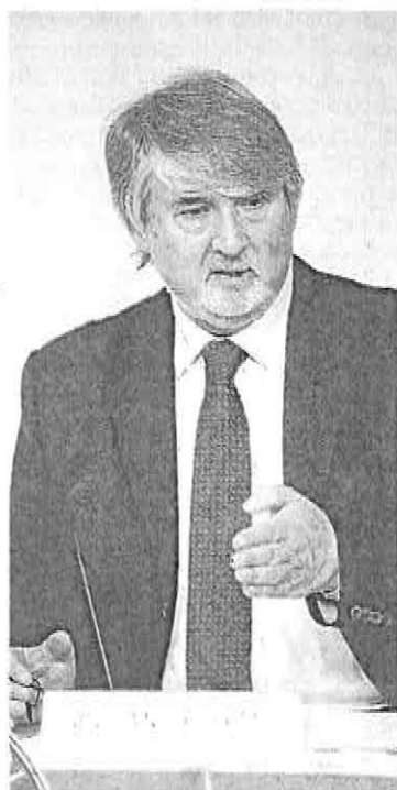
Il ministro del Lavoro Giuliano Poletti