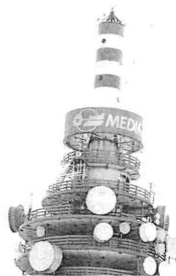
La contesa sulla pay-tv La sede di Mediaset a Cologno Monzese

Una strada che appare praticamente scontata, sempre che di qui alla riunione del board non ci sia qualche novità o una rimodulazione della nuova proposta di Vivendi. Intanto, mentre la Consob segue con attenzione gli sviluppi della vicenda, ieri il titolo ha pagato il dietrofront del gruppo capitanato da Vincent Bolloré con una perdita del 6,9% a Piazza Affari.