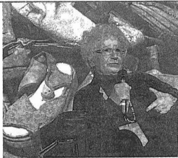
La senatrice Liliana Segre, vittima di minacce e insulti sui social

ROMA - Nel suo ufficio al secondo piano del Viminale, Luciana Lamorgese, ministra dell'Interno, indica cortesemente il divano per gli ospiti che ritiene evidentemente più adatto alla conversazione che ha accettato di affrontare. Sorride. E poi si fa seria. «Le dico la verità, sono piuttosto preoccupata», esordisce. «E lo sono da ministro dell'Interno e da donna delle Istituzioni, quale sono evidentemente per funzione, ma, soprattutto, quale sento di essere come cittadina e come sono sempre stata. Le lettere al fondatore di Repubblica Eugenio Scalfari, i messaggi di odio al direttore Carlo Verdelli, sono in sé, e sottolineano in sé, un fatto di estrema gravità. Perché vede, non ha importanza, alla fine, quale tipo di sostanza risulterà essere la polvere che contenevano quei plichi indirizzati a Scalfari. E dunque scoprire che magari si tratta di gesso, o, al contrario, di sostanza stupefacente, o chi sa cos'altro. Né ha importanza sapere quali siano le reali intenzioni di chi manifesta il suo odio contro Verdelli sulla rete o con lettere private. O cosa avesse in testa chi a gennaio ha telefonato alla redazione del vostro giornale annunciando una bomba. Quel che conta è il gesto. Perché il gesto, in sé, indica insieme un'emergenza e un fallimento».