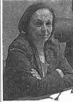
▲ La ministra Luciana Lamorgese, 66 anni, ministra dell'Interno dal 5 settembre scorso. Prima di lei al Viminale c'era Matteo Salvini, nel primo governo presieduto da Giuseppe Conte

—66— Di Salvini non parlo. Ma la politica tutta, a prescindere dagli schieramenti e dalle legittime convinzioni personali, ha bisogno di una igiene delle parole e dei comportamenti. Anche perché la progressiva assuefazione ha già fatto danni —99—