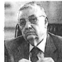
Giuseppe Pignatone, 70 anni, entra in magistratura nel 1974. Lavora oltre trent'anni a Palermo, occupandosi di numerose indagini contro la mafia, come quella che porta all'arresto del superlatitante Bernardo Provenzano. Dopo 4 anni alla guida della procura di Reggio Calabria, nel 2012 diventa procuratore a Roma fino a raggiungere la pensione nel maggio 2019. Il 3 ottobre scorso il Papa lo ha nominato presidente del Tribunale del Vaticano

ce, la pubblicazione riguarda atti non più segreti, secondo la definizione del codice, perché già a disposizione di indagati e difensori. Con questo non si vuole affermare che a consegnare gli atti ai giornalisti siano necessariamente i difensori: ritengo anzi che il passaggio sia più spesso opera di qualche magistrato e/o esponente della polizia giudiziaria. In ogni caso non si tratta di un illecito, proprio perché è venuto meno il requisito della segretezza.