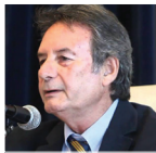
Felice Cavallaro Corriere della Sera