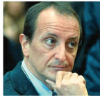
Riccardo Arena Giornale di Sicilia

Il Premio è suddiviso in quattro sezioni: Stampa estera; Stampa nazionale (sezione carta stampata, testate online e agenzie di stampa); Stampa nazionale (sezione tv, radio e Internet audio-video); Giornalista emergente (under 30).