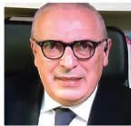
Xavier Jacobelli Tuttosport