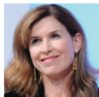
Trisha Thomas Associated Press