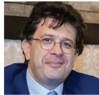
Gaspare Borsellino Italtpress