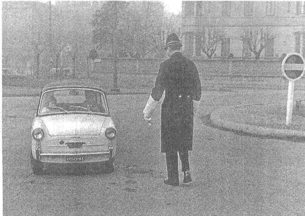
Tre foto di Gianni Berengo Gardin: a Milano nel 1959; a Venezia nel 1958 (la spiaggia di Malamocco) e a Venezia nel 1959 (Piazza San Marco)

di distacco. Berengo Gardin, da buon fotoreporter, vive per strada, ne cattura le storie, ma non vi si mescola davvero. È sempre un passo indietro o sopra. Il mondo è un gran teatro, lui sta in mezzo al palco ma non prende parte alla rappresentazione. Berengo Gardin è sostanzialmente (sia detto senza pregiudizi) un fotografo borghese. Nel suo bianco e nero non bisogna cercare i registri dell'epica e del tragico. È sufficiente fare una verifica con i temi che più suggeriscono un approccio drammatico. La sezione della mostra dedicata al lavoro è esemplare: gli uomini sono inseriti in inquadrature geometrizzanti o dispersi in spazi metafisici. Per paradosso i soli "lavoratori" dotati davvero di un volto sono i designer Castiglioni, Rossi, Mari e Mendini in tuta negli stabilimenti dell'Alessi. Un distacco che riscontriamo anche nei due reportage più celebri di Berengo Gardin: Morire di classe , sui manicomi, e Zingari . Il primo, realizzato insieme a Franco Basaglia, contribuì in modo capitale a diffonderne le idee: e proprio nell'ottica