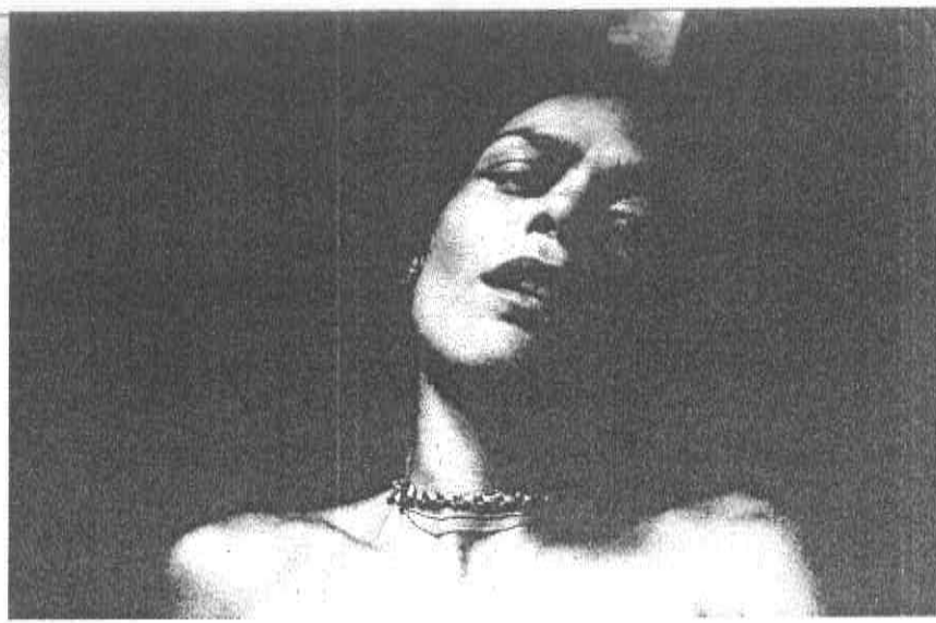
Alex Majoli Magnum Photos «Italy, Cesura», 2005