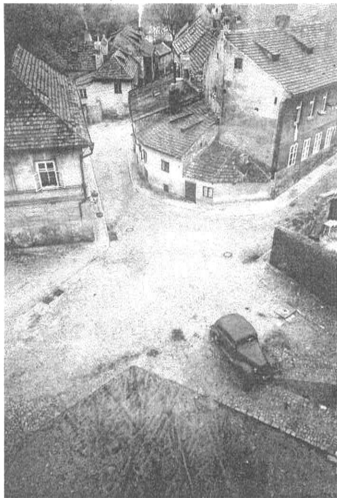
Franco Fontana Collezione privata «Praga 1967»

Un'immagine della presentazione ieri pomeriggio di Camera, il centro italiano per la fotografia. Il nuovo spazio sarà ospitato a Torino nell'edificio di via delle Rosine dell'Opera Municipale Istruzione di Santa Pelagia, che finora ospitava una scuola. Nel cortile sono previsti il padiglione per la didattica e la caffetteria del centro che aprirà tra un anno.