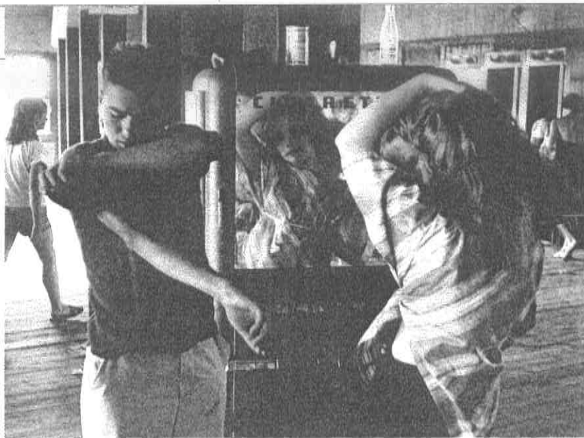
«Brooklyn Gang. Coney Island», New York 1959

Rubando la definizione di Majoli Camera potrebbe diventare davvero un Hub della fotografia internazionale, rimarginando così la ferita ancora aperta a Torino della morte per eutanasia (o meglio per l'indifferenza di politici e istituzioni) della Fondazione Italiana per la fotografia, che pionieristicamente già negli Anni 90 organizzava grandi mostre di Helmut Newton o Duane Michals, biennali internazionali dedicate al cibo (quasi profetiche se si pensa all'Expo) e attività didattiche. La ricorda il fotografo Ferdinando Scianna: «Mi stupisce - afferma - che alcune istituzioni riscoprano oggi l'importanza della fotografia dopo aver fatto morire la Fondazione. Ma in un momento di difficoltà veder nascere un nuovo spazio è senza dubbio una buona notizia». Il progetto dell'allestimento è affidato all'architetto Be-